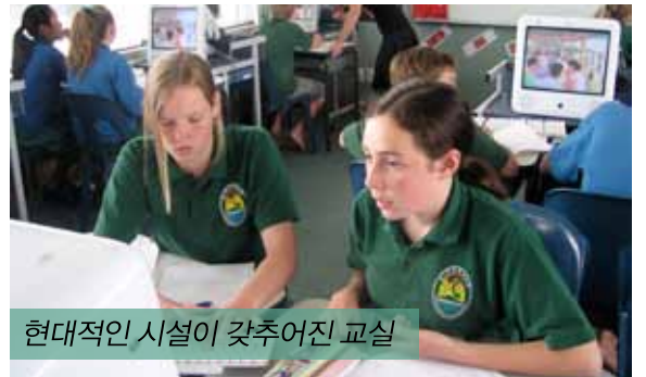
현대적인 시설이 갖추어진 교실