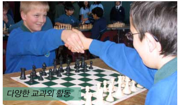
다양한 교과외 활동