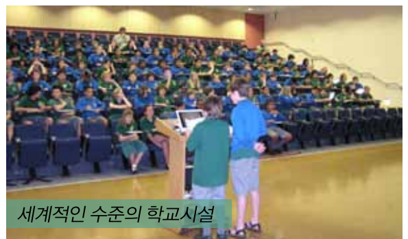
세계적인 수준의 학교시설

웹사이트 주소: www.bis.school.nz 추가정보를 위한 이메일: office@bis.school.nz